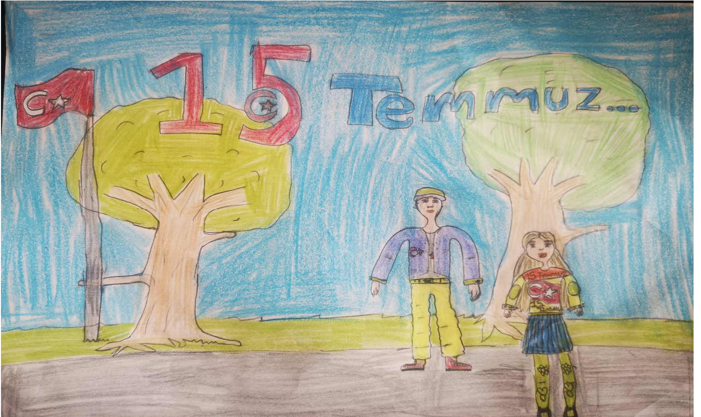
6/A SELVİNUR KAPLAN